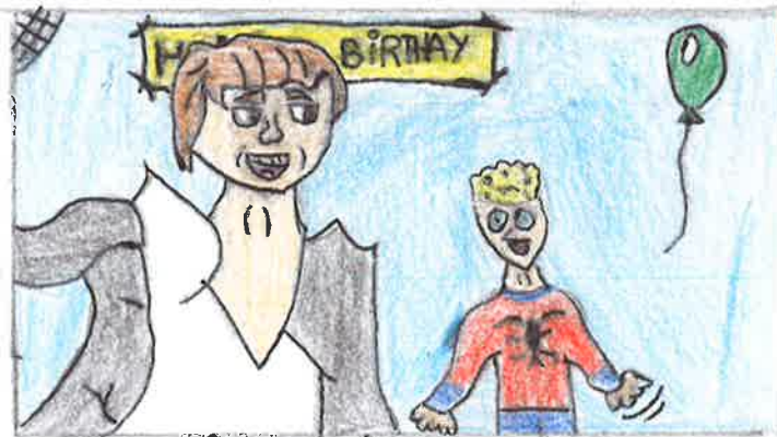
Tom Holland en la fiesta.

Todo pasó cuando Tom Holland estaba de vacaciones en Madrid y decidió salir a caminar solo para conocer mejor Madrid. Pero como no conocía bien las calles, se confundió y terminó entrando en una casa donde había